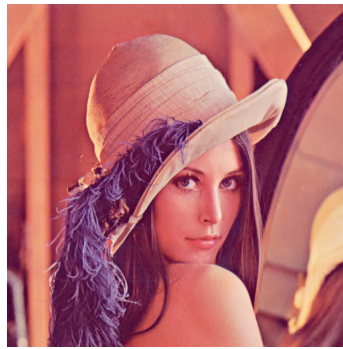
Abb. 7.1.: Lenna , ein sehr bekannte Bild in Image processing

Die Positionierung von Bilder kann man mit zusätzlichen Paketen feiner gestalten. In dem nächsten Abschnitte werden wir diesen Paketen kennenlernen.