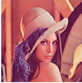
(a) Ohne Rotation