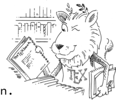
Abb. 7.3: Der \text{\LaTeX} -Löwe

1 \begin{wrapfigure}[<Zeile>]{<Position>}{<Abstand>}{<Breite>} 2 % Befehlen wie in der Umgebung "figure" kann man hier benutzen. 3 % Z.B \centering, \includegraphics, \caption, \label 4 %... 5 \end{wrapfigure}