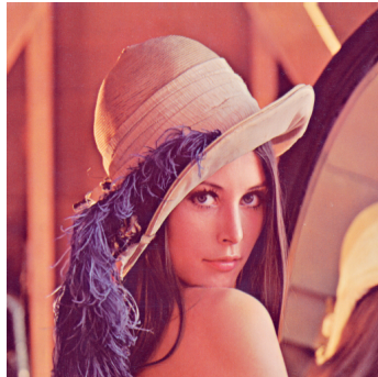
Abb. 7.1: Lenna, ein sehr bekannte Bild in Image processing

Die Positionierung von Bilder kann man mit zusätzlichen Paketen feiner gestalten. In dem nächsten Abschnitte werden wir diesen Paketen kennenlernen.