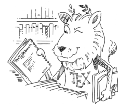
Abb. 7.3: Der \LaTeX -Löwe

1 \begin{wrapfigure}[<Zeile>]{<Position>}[<Abstand>]{<Breite> 2 % Befehlen wie in der Umgebung "figure" kann man hier benutzen. 3 % Z.B \centering, \includegraphics, \caption, \label 4 %... 5 \end{wrapfigure}