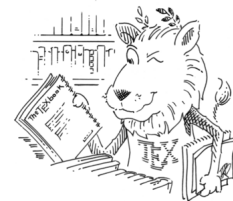
Abb. 7.3: Der \text{\LaTeX} -Löwe

1 \begin{wrapfigure}[<Zeile>]{<Position>}[<Abstand>]{<Breite> 2 % Befehlen wie in der Umgebung "figure" kann man hier benutzen. 3 % Z.B \centering, \includegraphics, \caption, \label 4 %... 5 \end{wrapfigure}