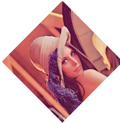
(b) Mit Rotation